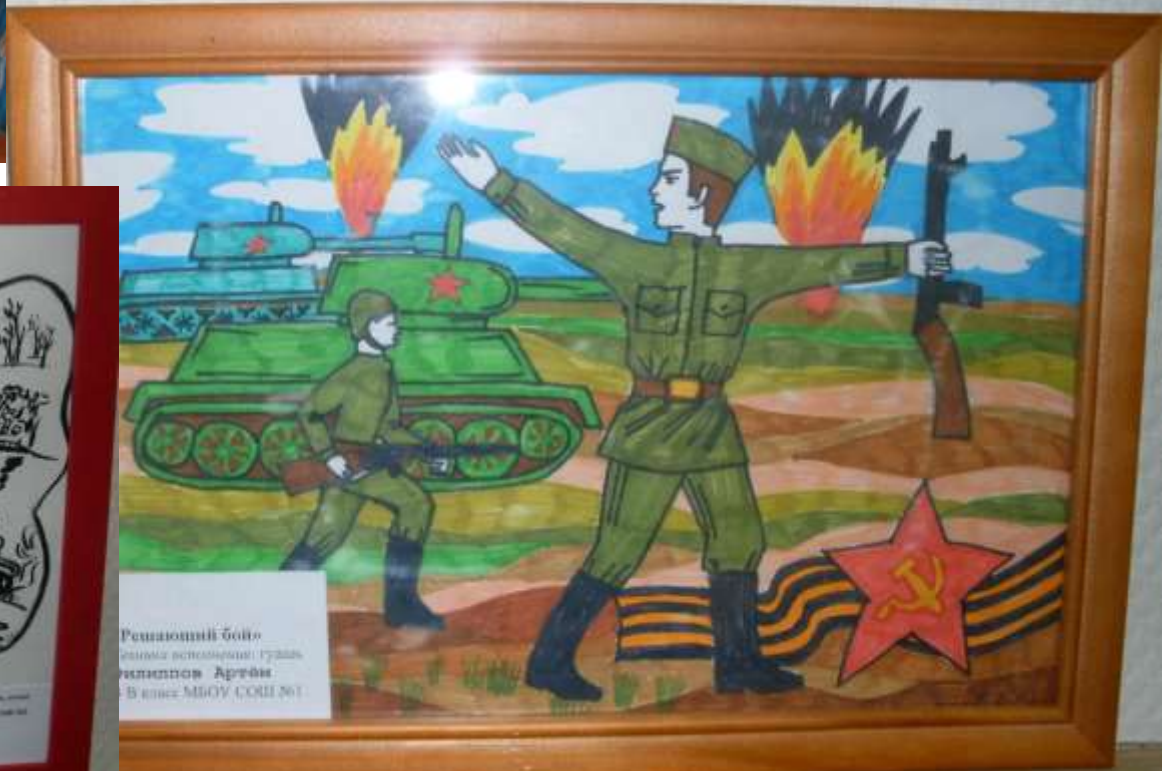
Решающий бой отсюда возвращались Герои отважные Артеды В классе МБОУ СОШ №6