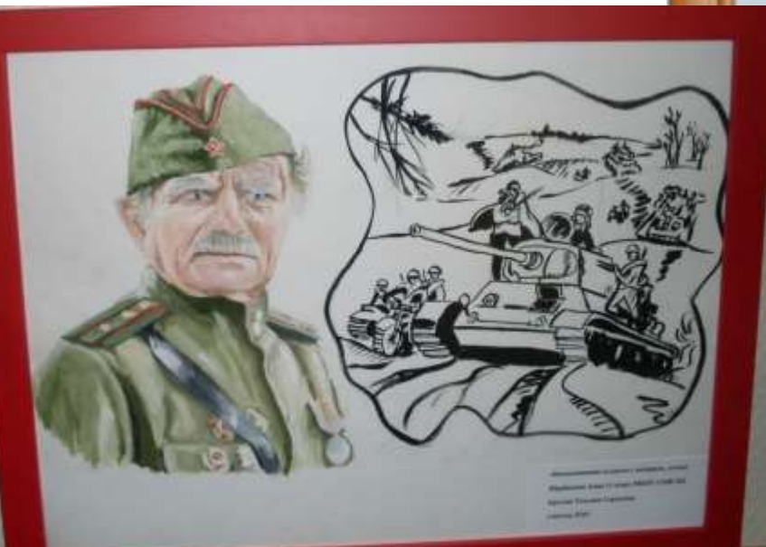
Министерство обороны, артиллерия, артиллерийский полк 111 полка МВК 111 полка МВК Министр Обороны Сержант Сержант