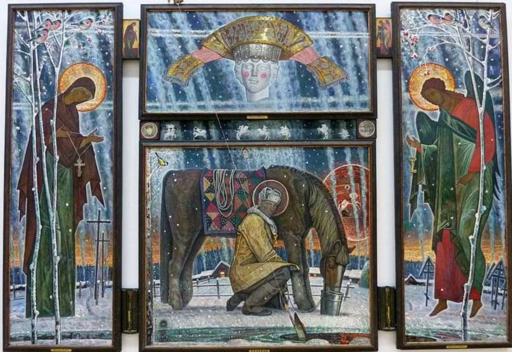
Работы Вячеслава Федоровича Самарина