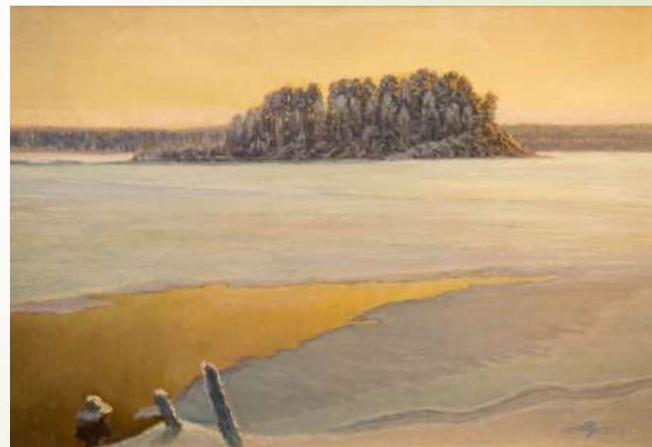
Артур Вуймин – живописец «Смоленского Поозерья»