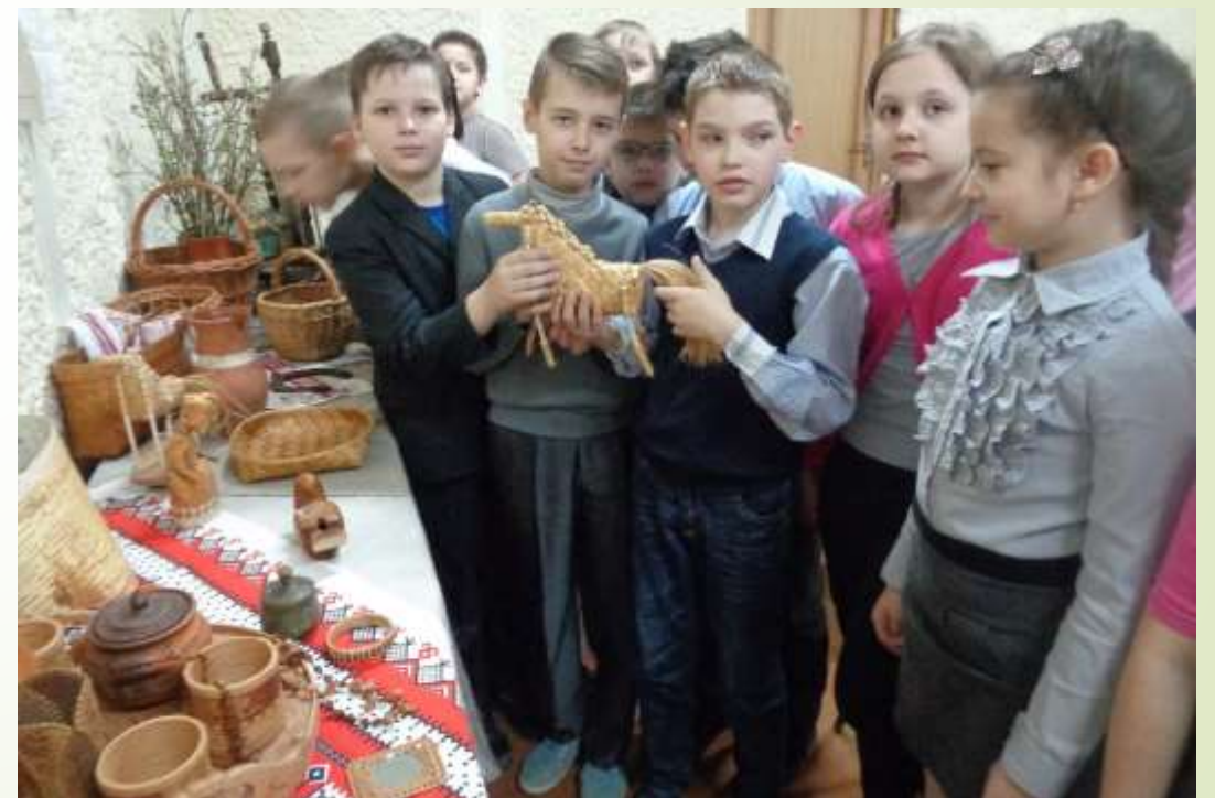
«Народные промыслы России»