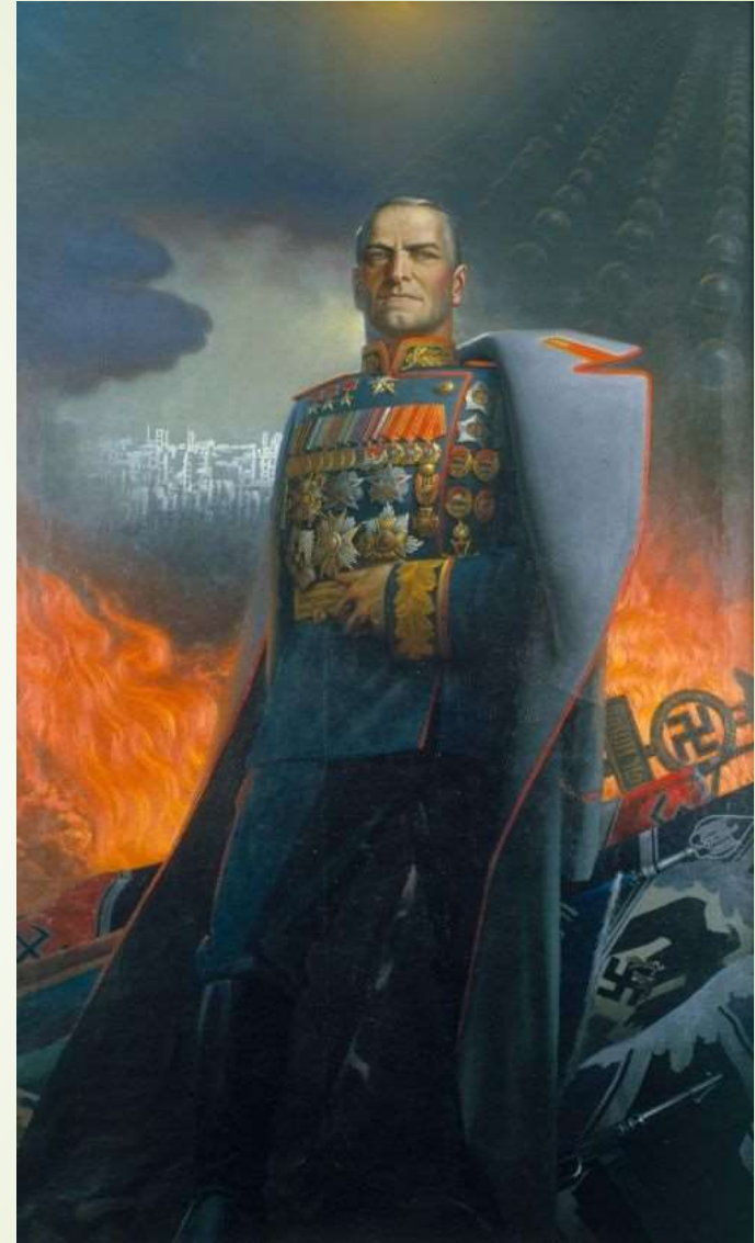
Работы Константина Васильева