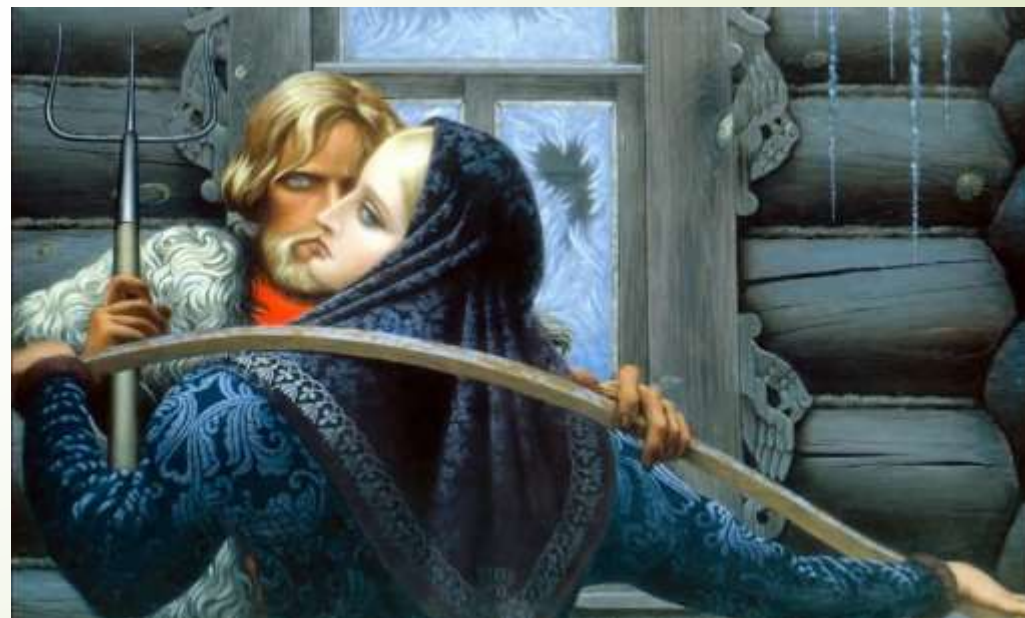
Работы Константина Васильева