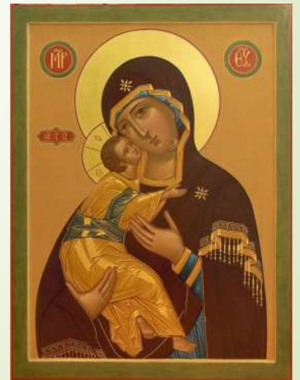
Тема «Русская Мадонна»