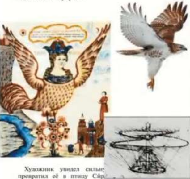
Художник увидел сильную птицу и превратил её в птицу Сайрыс.

Художник рисует не только то, что видит вокруг, но и то, что ему подсказывает фантазия. Придумывать фантастические образы художника вдохновляет природа.