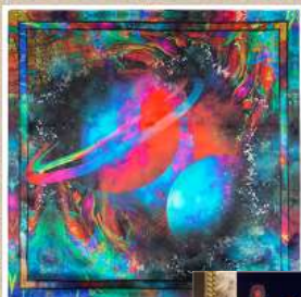
Платок атласный шелковый "Космос"