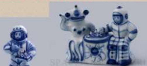
Статуэтка «КОСМОНАВТ И ИНОПЛАНЕТЯНИН С ШАХМАТАМИ» авт. Гаранин Ю.Н. 2011г.