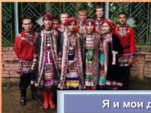
Я и мои друзья