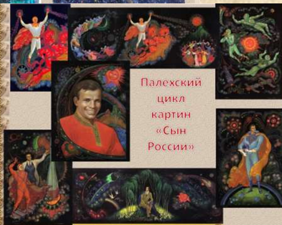
Палехский цикл картин «Сын России»