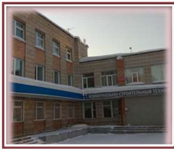
Томский коммунально-строительный техникум