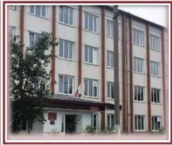
Томский техникум социальных технологий