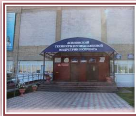
Асиновский техникум промышленной индустрии и сервиса