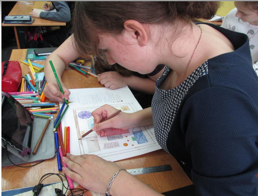
Урок изобразительного искусства в 8 классе «Дизайн и архитектура моего сада» Учитель Никитина О.И.