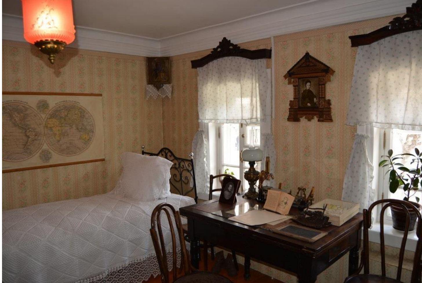
Комната И.П. Павлова в доме-музее