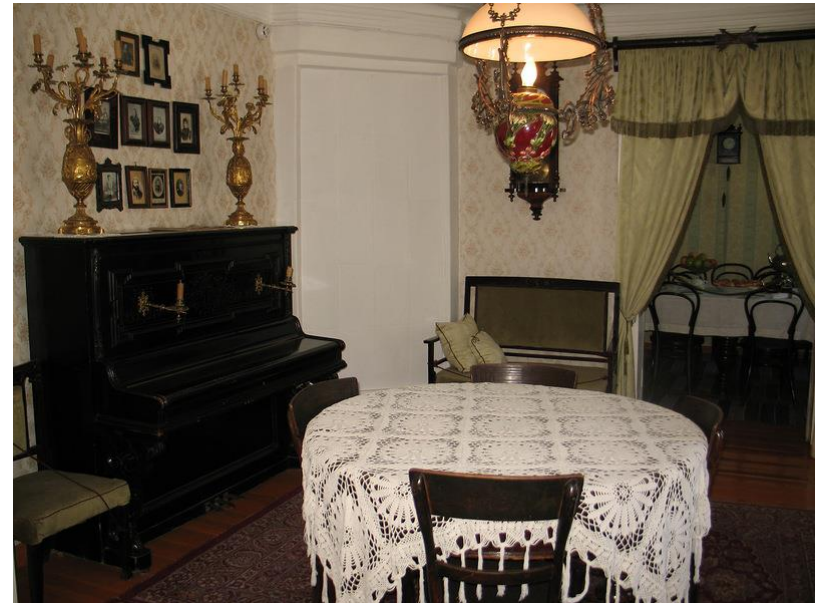
Гостиная в доме семьи