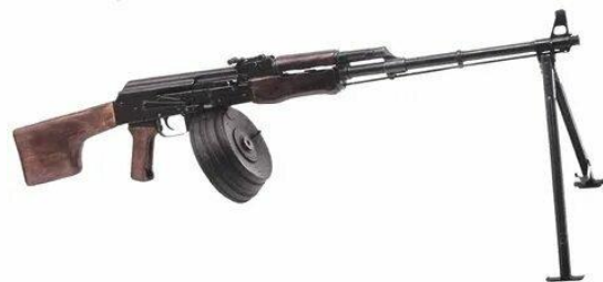
Ручной пулемет Калашникова