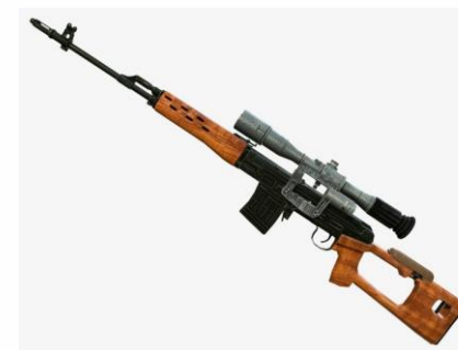
Снайперская винтовка Драгунова