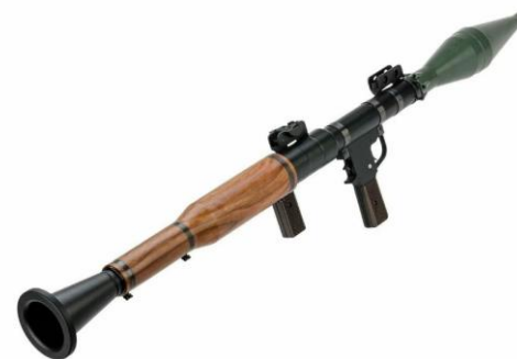
Ручной противотанковый гранатомет