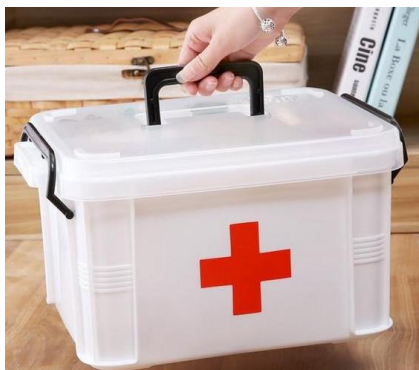
ЕС 01 Аптечка первой медицинской помощи

Утвердили два вида аптечки: для образовательных организаций и для работников