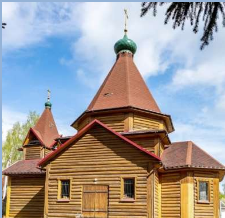
Храм св. бессребреников и чудотворцев Косьмы и Дамиана Ассийских Д. Жуково

МБОУ Стабенская средняя школа Смоленского муниципального округа Смоленской области