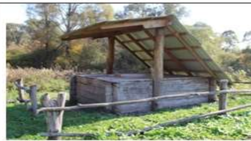
3. с. Зинаидино