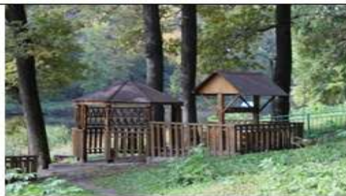
2. с. Центральное