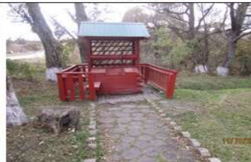
6. с. Введенская Готня