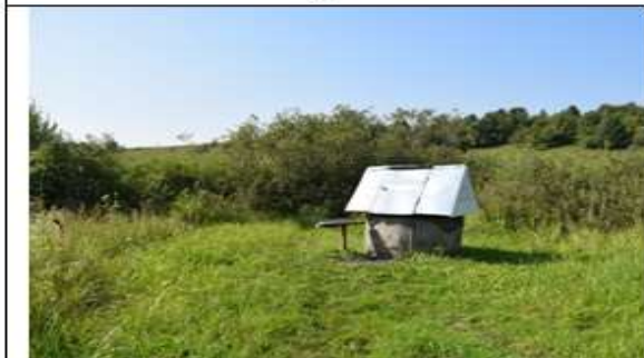
4. с. Цыбулевка