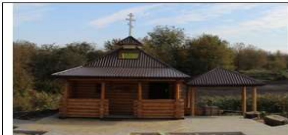
1. Ракитное, ул. Заводская