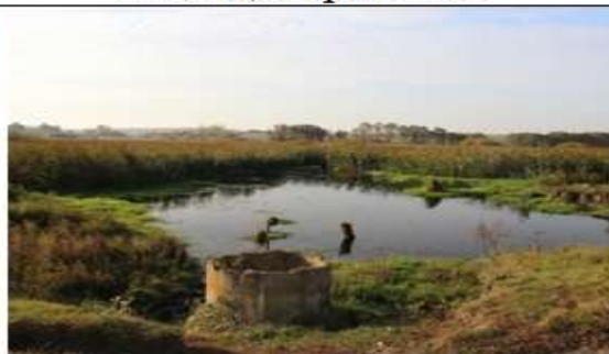
5. х. Ивенка