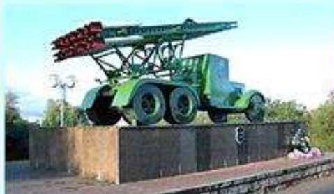
Орша. Памятник БМ-13-16 - "Катюше"

на вы - со - кий бе - рег, на кру - той.