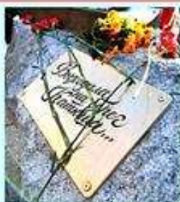
Владивосток. Памятник Катюше