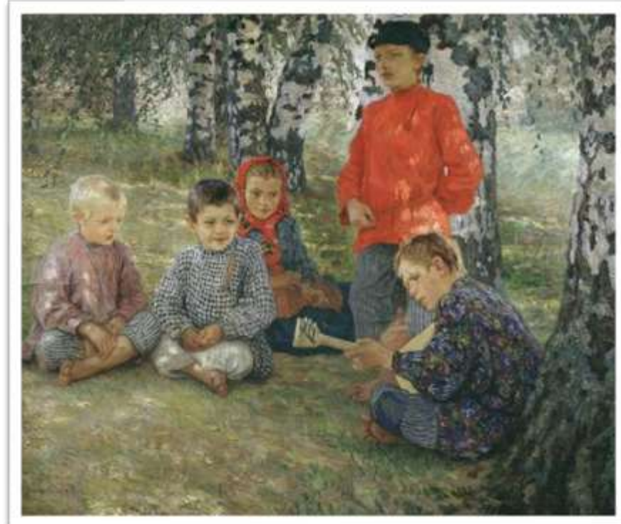
Виртуоз. 1891, Национальный музей Грузии, Тбилиси