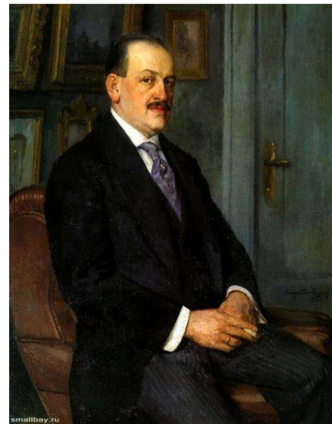
Н.П. Богданов-Бельский. Автопортрет 1915, Луганский областной художественный музей

Когда-то я так же стоял у порога школы, затаив дыхание... Возьмут-не возьмут?