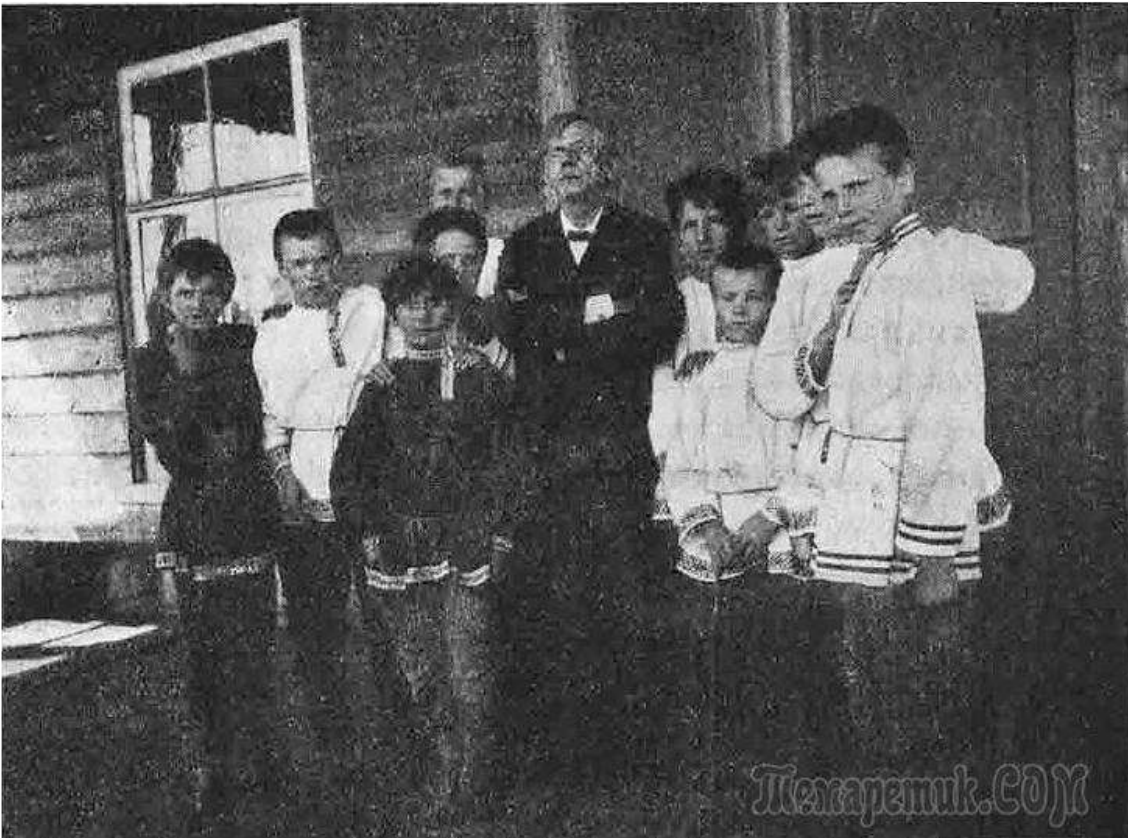
С.А. Рачинский с учениками на пороге школы

«Школа захватывает всю жизнь ребенка и становится великою силою, налагающею на него неизгладимую печать. Как это зависит от духа школы, от ее организации, от лиц, ею управляющих».