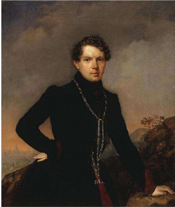
Муравьев Андрей Николаевич (1806 - 1874)