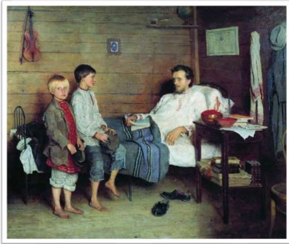
У больного учителя. 1897г. ГТГ, Москва

«Помните, что вам надо не обуздывать ваших учеников и не бороться с ними, а жить с ними в любовном общении истины и добра».