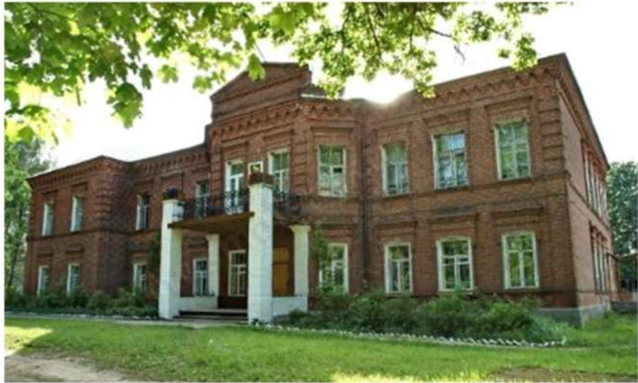
МКОУ Татевская средняя общеобразовательная школа им.С.А.Рачинского

Надпись на плите «Не хлебом единым жив человек»