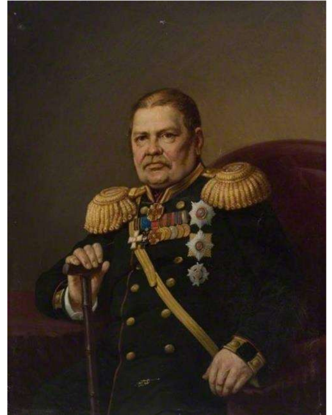
Михаил Николаевич Муравьев (1796–1866)