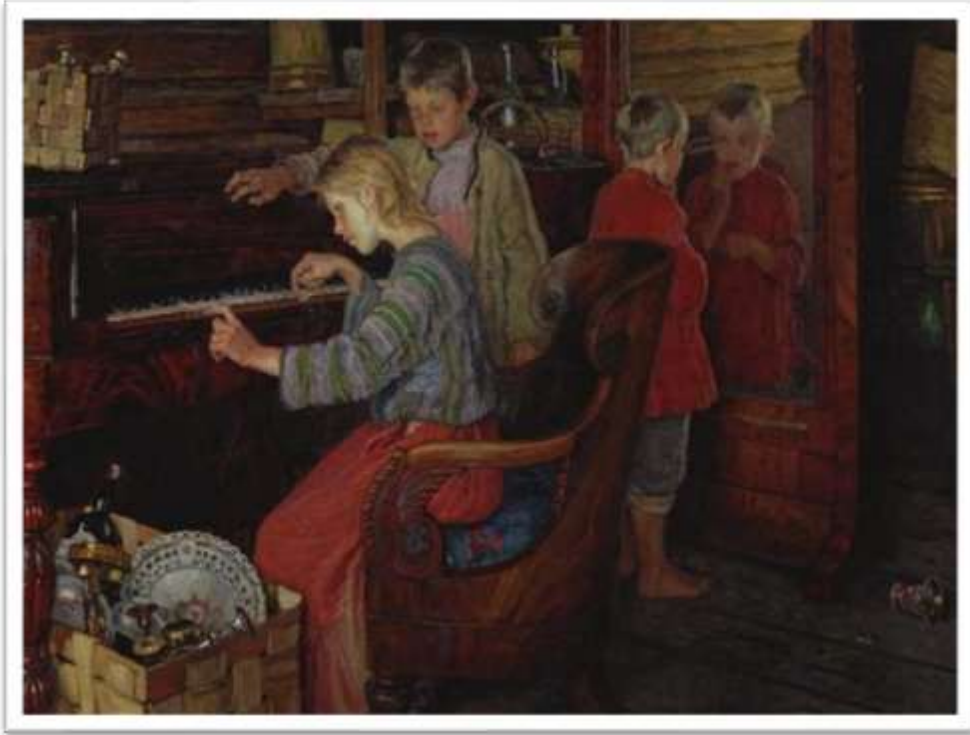
Дети за пианино. 1918г. ГТГ, Москва