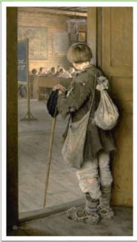
У дверей школы 1897, Русский музей Санкт-Петербург

Когда-то я так же стоял у порога школы, затаив дыхание... Возьмут-не возьмут?