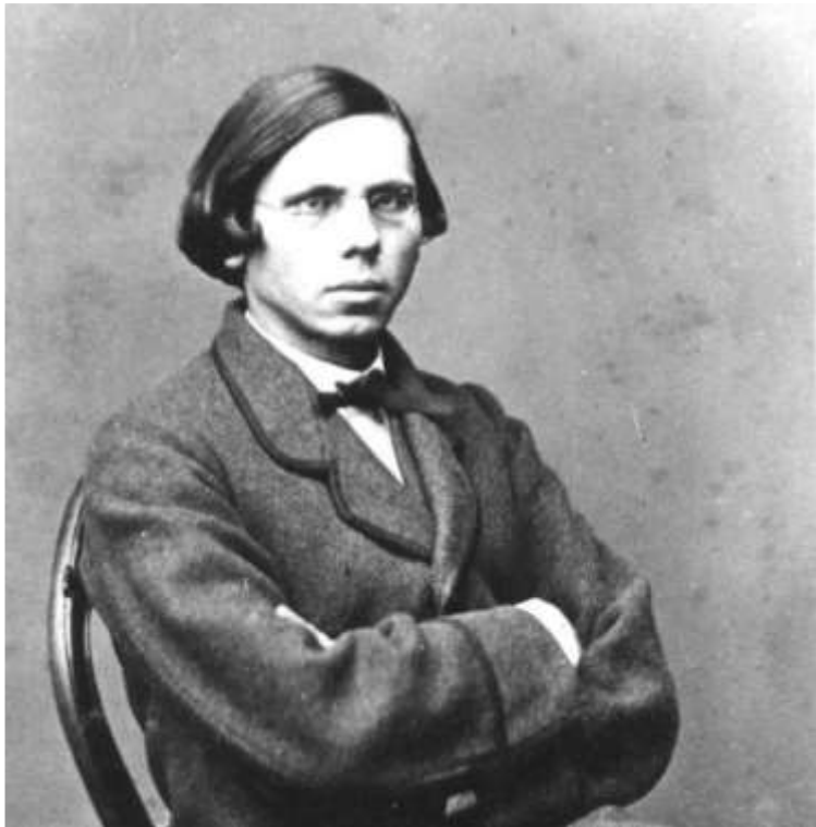
Сергей Александрович Рачинский (1833-1902)

«Негоже людям, умеющим и знающим, сидеть сложа руки, когда и ум, и сердце их могут быть задействованы на прекрасную работу: воспитывать и образовывать детей.