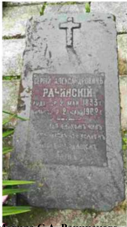
Могила С.А. Рачинского.

Надпись на плите «Не хлебом единым жив человек»