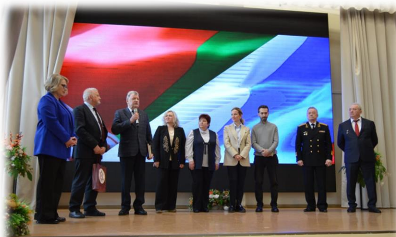
г.Минск, школа №160