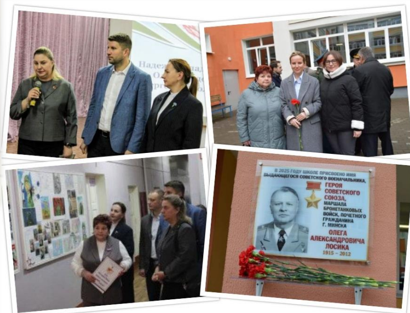
г.Ярцево, школа №4