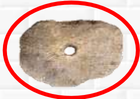
ГАДКИЕ КАМНИ С ОТВЕРСТИЕМ