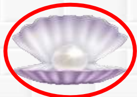
РАКУШКИ \ ЖЕМЧУГ