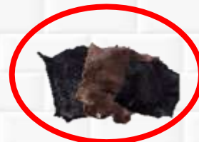
ШКУРА ЖИВОТНЫХ \ МЕХ