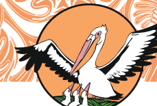
ГРАФИК ПРОВЕДЕНИЯ УЧЕБНЫХ ЗАНЯТИЙ УЧАСТНИКАМИ КОНКУРСА «УЧИТЕЛЬ ГОДА» В МБОУ «СШ № 27 ИМ. Э.А. ХИЛЯ»