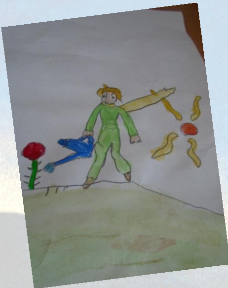
Софья, 8 лет