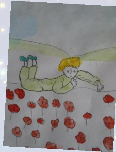
Ира, 8 лет