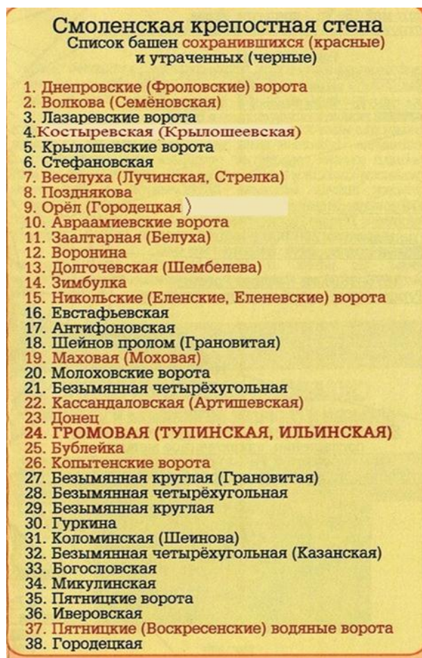
Рис. 4. Список башен Смоленской крепостной стены

Задание 6. Прочитай список башен Смоленской крепостной стены (Рис.4).