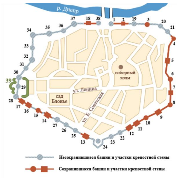
Рис. 5. Изображение крепостной стены

Задание 7. Рассмотрите изображение крепостной стены (Рис.5).