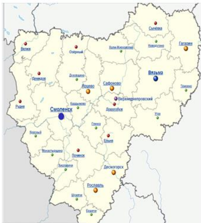
Рис. 6. Карта Смоленской области

Задание 2. Рассмотри карту Смоленской области (рис.6).