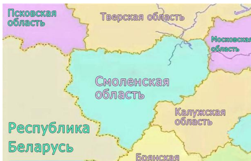
Рис. 3. Карта