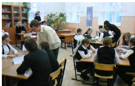
Волонтеры МБОУ Дорогобужская СОШ № 1 на занятиях с младшими школьниками