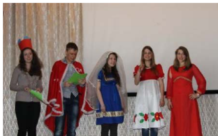
На районном сборе актива старшеклассников. Выступление агитбригады