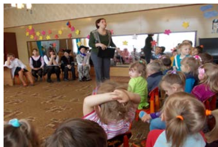
Мероприятия по правовому воспитанию в детском саду «Теремок