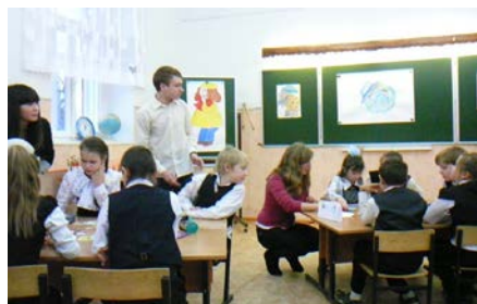
Волонтеры МБОУ Дорогобужская СОШ № 1 на занятиях с младшими школьниками