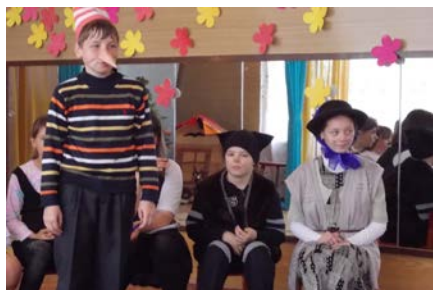
В гостях у воспитанников детского сада «Теремок» волонтеры Верхнеднепровской средней школы № 3