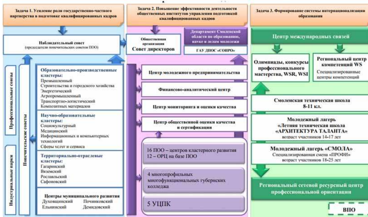
Рисунок 1. Модель системы среднего профессионального образования Смоленской области в горизонте 2017 года

В соответствии с «Дорожной картой» по сопровождению мероприятий, направленных на развитие системы среднего профессионального образования Смоленской области на 2015–2017 годы, комплекс мероприятий еще не исчерпан, но уже сейчас ведется работа по актуализации Модели региональной системы СПО на следующий период на основе анализа достигнутых результатов ее внедрения, изучения причин отклонений от целевых показателей и с учетом новых внешних вызовов.