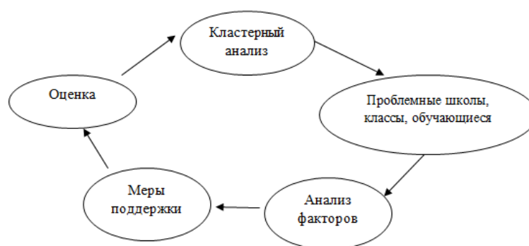
Модель использования данных оценочных процедур