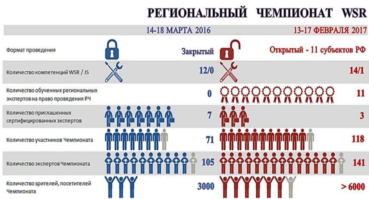
Рисунок 2. Показатели региональных чемпионатов WSR в Смоленской области

В целях обеспечения участия представителей Смоленской области в национальных чемпионатах «Молодые профессионалы» (WorldSkills Russia) в 2016 и 2017 годах проведены Региональные чемпионаты «Молодые профессионалы» (WorldSkillsRussia) Смоленской области (рис. 2).