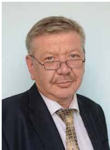
Колпачков Н.Н., начальник Департамента Смоленской области по образованию и науке