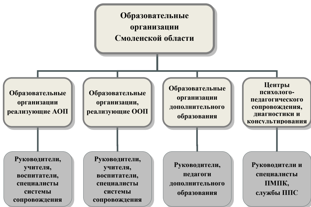
Рис. 2. Категории образовательных организаций и педагогов, на которых ориентирована система НМС

сопровождения. Следовательно, система НМС будет ориентирована на разные категории образовательных организаций и педагогов (рис. 2).