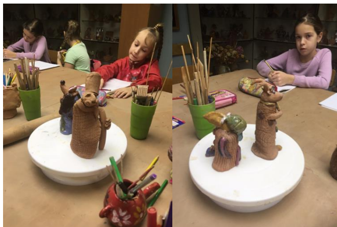
Демонстрация работ старшеклассников на занятии

«Наглядный пример» – постоянное использование в ходе занятий наглядных пособий, выполненных старшеклассниками: лучшие работы, которые остаются в методическом фонде школы, а также специально выполненные для тематических занятий. Надо отметить, что обучающиеся подготовительного отделения всегда с интересом узнают, кем и когда выполнена творческая работа, служащая наглядным пособием на занятии. [7, с. 46]