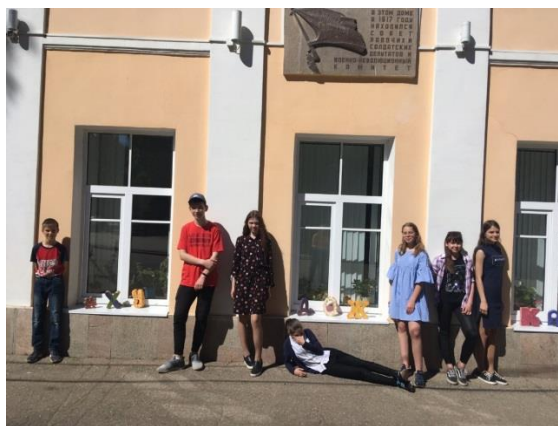
Приветствие от старшеклассников с инсталляцией из букв «Художка»

Преподаватель подготовительного отделения керамика говорит: «Вы стали почетным гражданами прекрасной страны под названием Детская художественная школа имени Марии Клавдиевны Тенишевой!» Пусть ваше творчество приносит вам радость, а полученные знания принесут вам пользу! Поздравляем!»