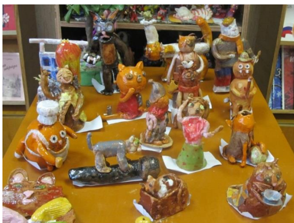
Работы обучающихся подготовительного отделения «Керамика» на выставке «Веселая Котовасия», г. Вязьма

В рамках наставничества «педагог-обучающийся» организуется ежегодная выставка «Учитель и ученики». Такое мероприятие, где педагог вместе с обучающимися совместно готовит выставочную работу, учит детей, наставляет их и учится у них. Такие выставки могут быть и выездными, то есть работы могут демонстрироваться не только в стенах школы, но и в других учреждениях, городах и т.д.