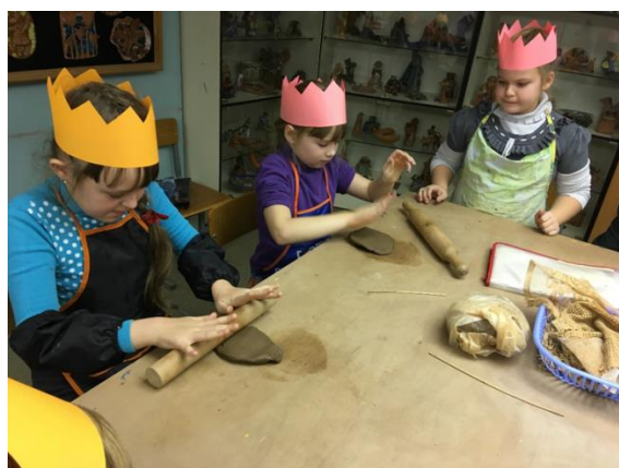
Практическое испытание «Раскатай пласт!»