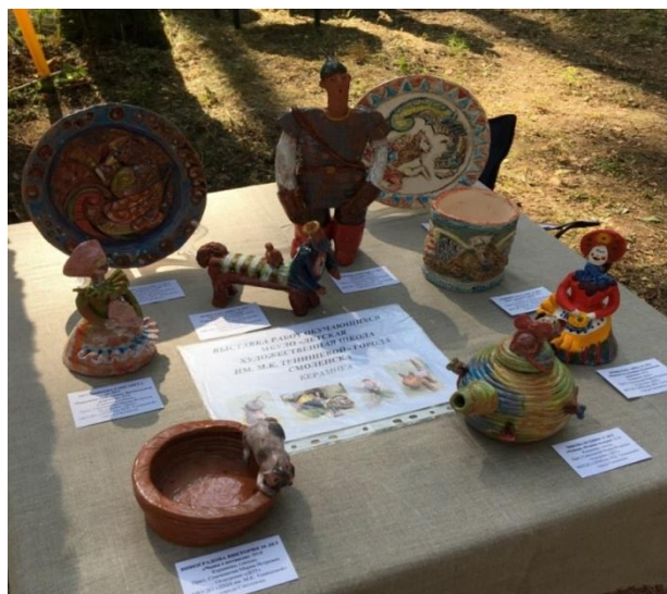
Выставка работ по керамике «Смоленский Рожок», Гнездово

Также наглядным примером для юных обучающихся выступают выставочные работы самого педагога. В стенах нашей школы имеется выставочный зал, в котором часто проводятся выставки. Это могут быть персональные выставки педагогов нашей школы, сборные выставки преподавателей, а также выставки приглашенных художников. Это дает возможность педагогу пригласить обучающихся на выставку, показать свои работы, работы своих коллег и рассказать историю их создания.