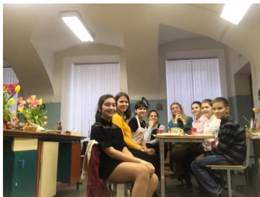
Выпускной на подготовительном отделении «Керамика»

В конце учебного года для ребят, заканчивающих обучение на подготовительном отделении «Керамика», проводится выпускной в игровой форме. Старшеклассники готовят задания и испытания для выпускников.