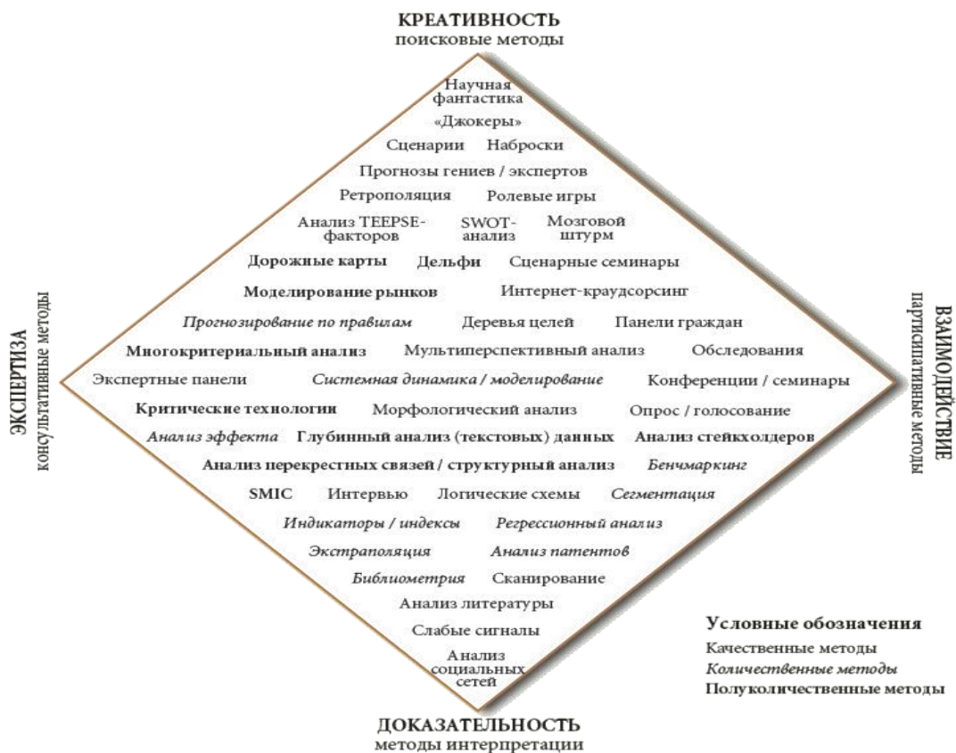
Рис. 2. Структура форсайта (ромб)

Сегодня, когда статистике и количественным исследованиям уделяется особое внимание, к критериям креативности, экспертизы и взаимодействия прибавилась доказательность, соответственно структура форсайта выглядит следующим образом: