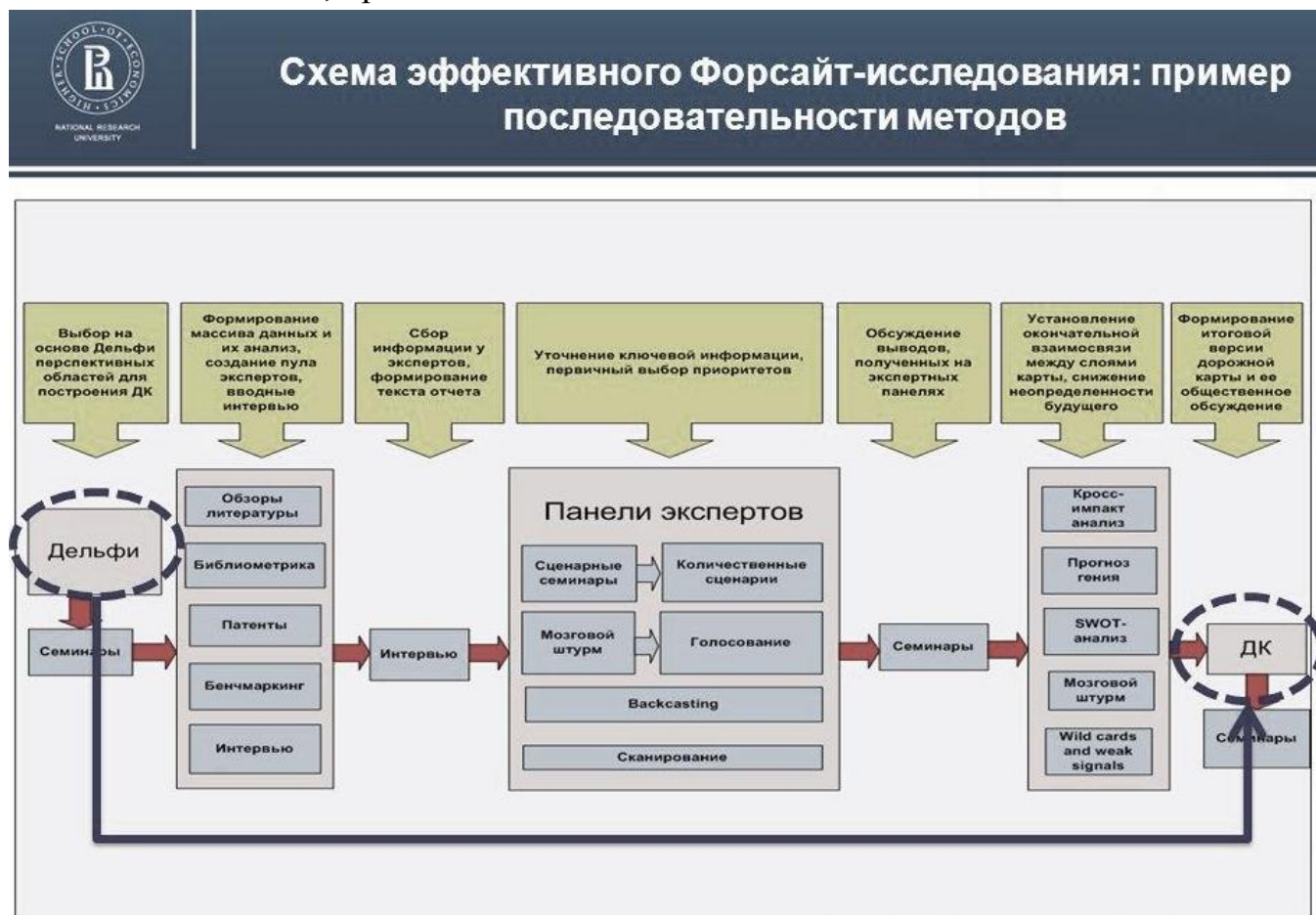
Рис. 3. Схема эффективности Форсайт-исследования

Для достижения эффективности использования форсайта необходимо обеспечить не только оптимальное сочетание различных методов, но и определенную последовательность их применения. Ниже представлен пример последовательности, предлагаемой Высшей школой экономики.