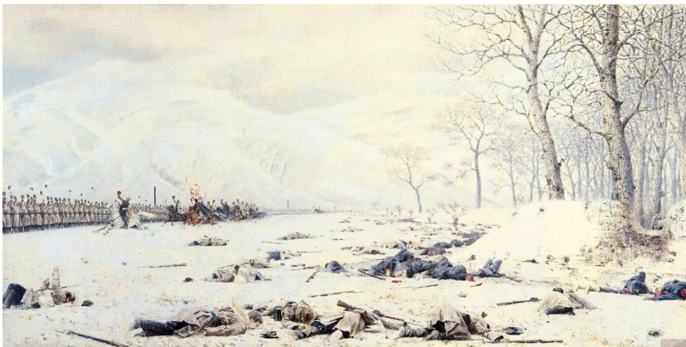
Шипка — Шейново. Скобелев под Шипкой