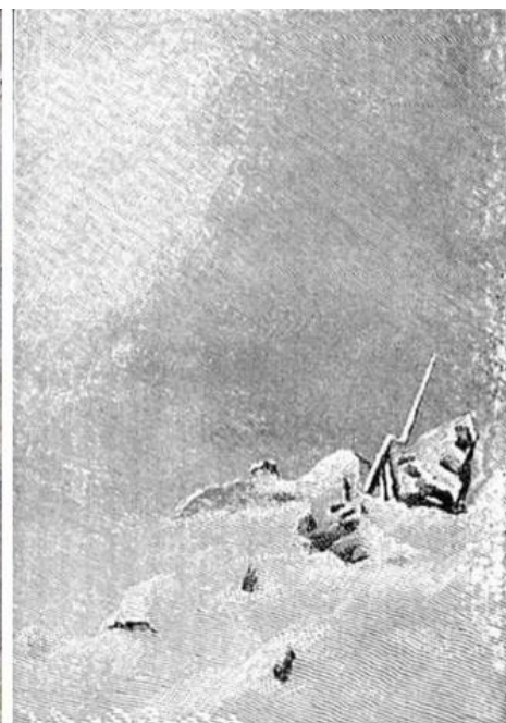
На Шипке всё спокойно