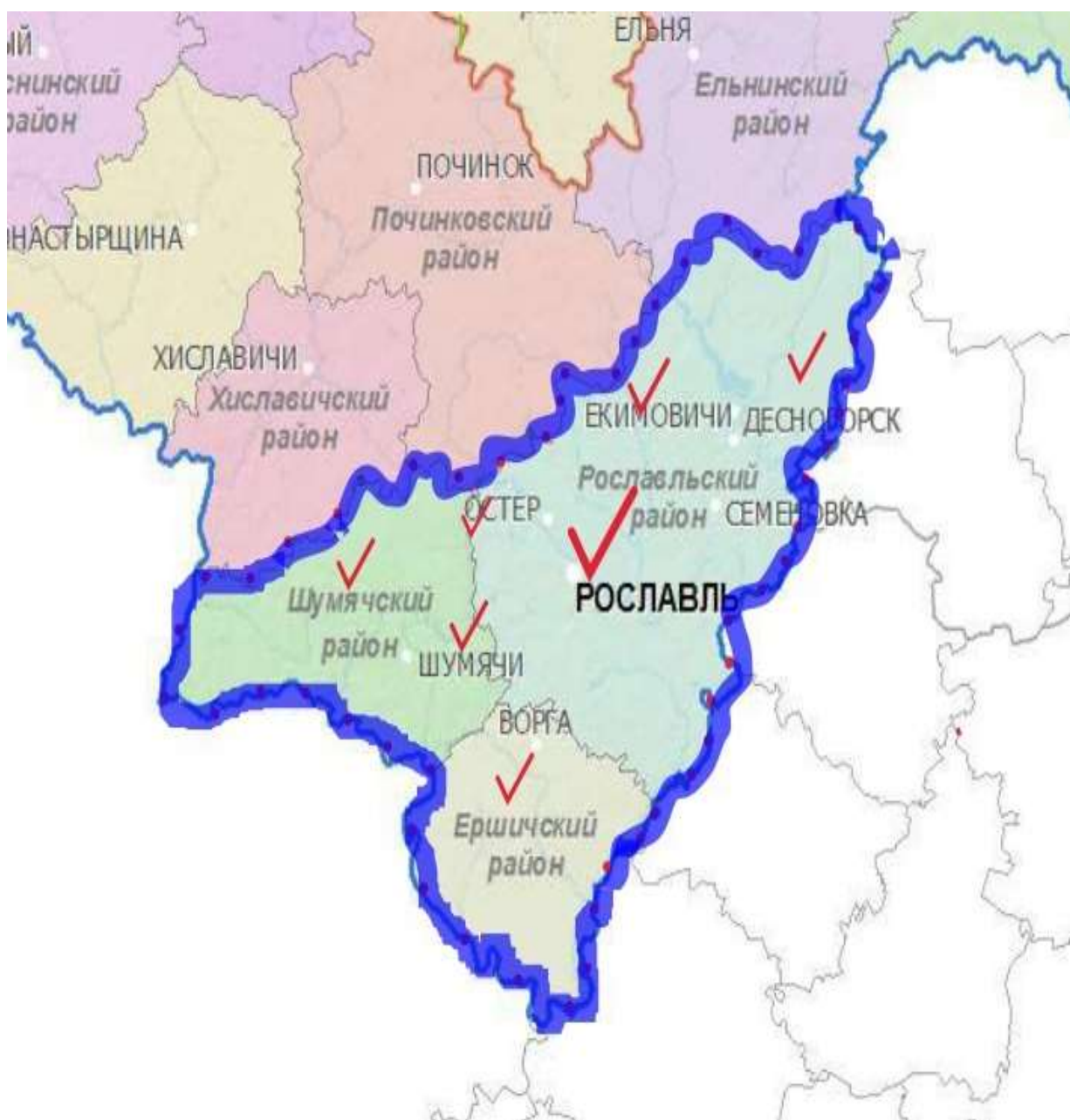
Рис.2. Территория южных районов Смоленской области

Система реализации услуг (мероприятий по реализации услуг) предусматривает взаимодействие различных структур (Рисунок 3).