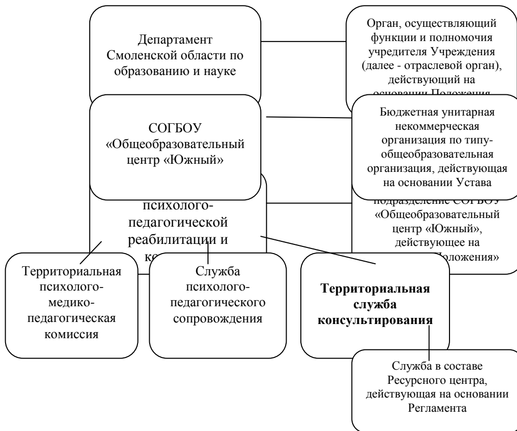
Рис.1. Организационно-правовая модель Территориальной службы консультирования

Ресурсного центра и создать в Учреждении Территориальную службу консультирования, для реализации мероприятий по психолого-педагогическому сопровождению семей с детьми в рамках реализации регионального проекта «Поддержка семей, имеющих детей» на территории Смоленской области.