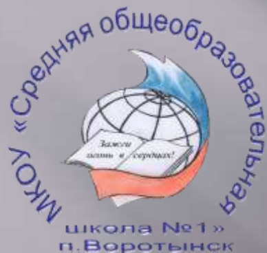
МКОУ «СОШ №1» п. Воротынский Бабынинского района Калужской области