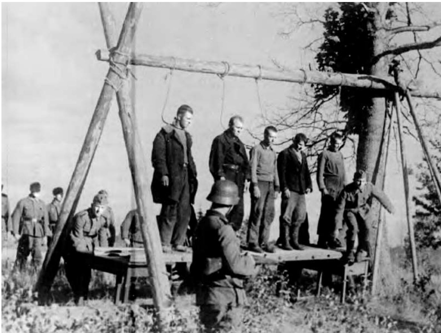
Вот пятерых приготовили к казни