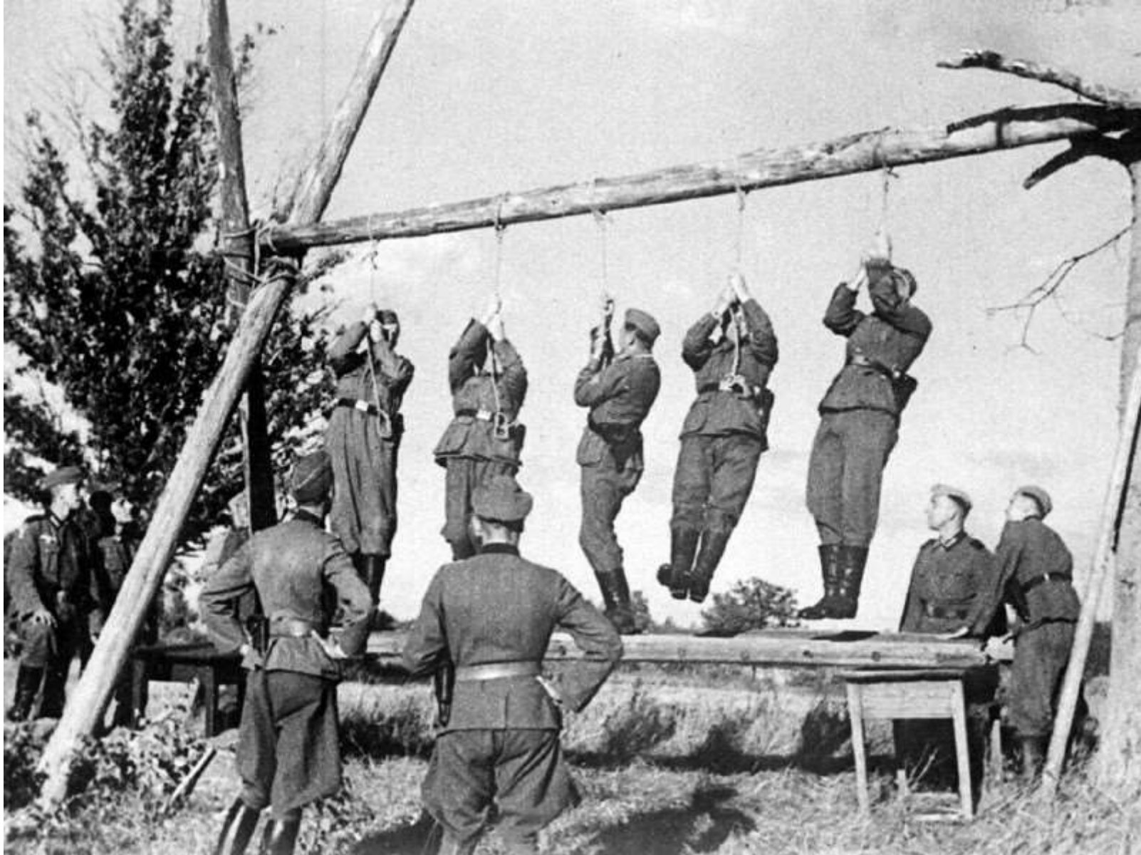
Перед казнью немцы проверяют хороши ли веревки, ощущение безмятежности и «расового» превосходства во всех их движениях