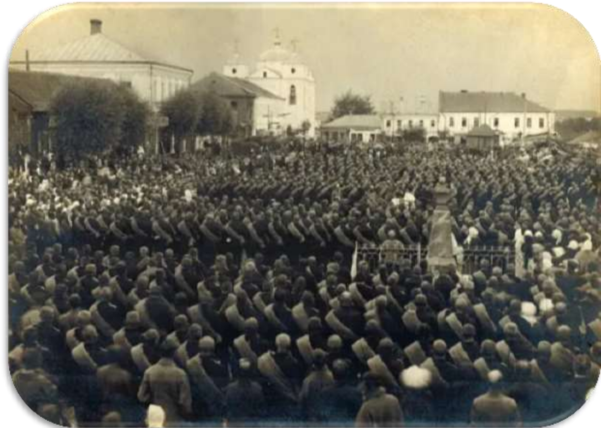
Бюст на городской площади август 1914 год.

В 1812 году Император Александр I во время проезда через Велиж слушал литургию в Николаевской церкви и пожертвовал на иконостас 1000 руб. ассигнациями.