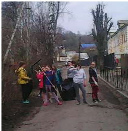
Уборки территорий, воинских захоронений