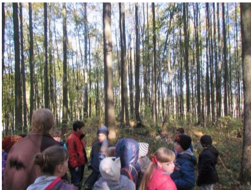
Урок – экскурсия с учителем технологии, историком-краеведом А.С. Ивановым