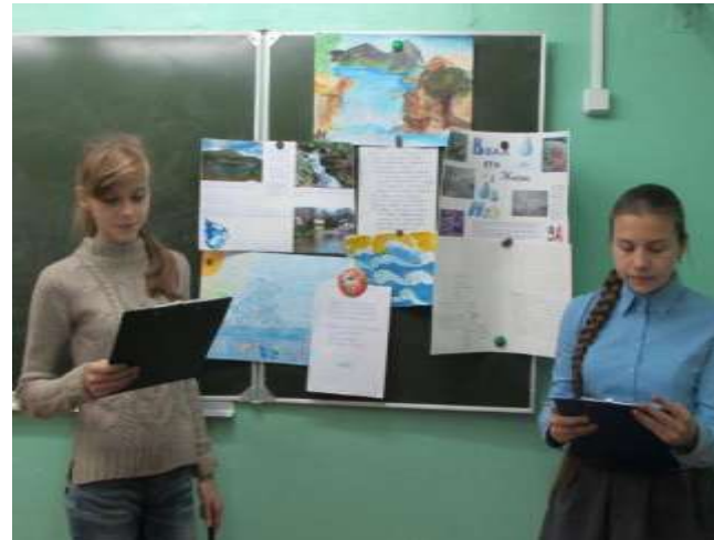
Всероссийские экологические уроки