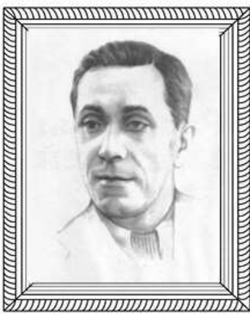
Михаил Михайлович Зощенко