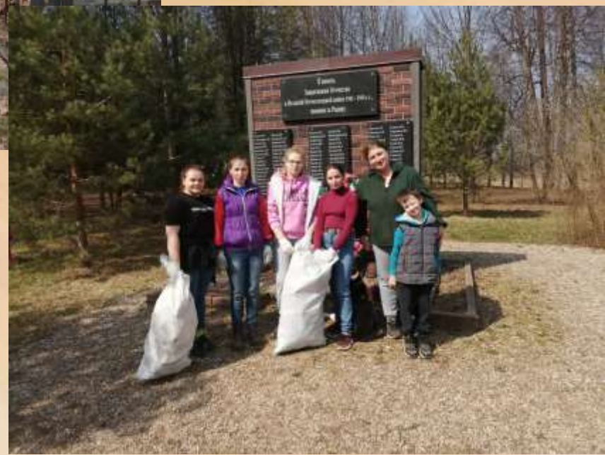
Братская могила №8 расположена в деревне Самуилово Самуйловского сельского поселения Гагаринского района Смоленской области.