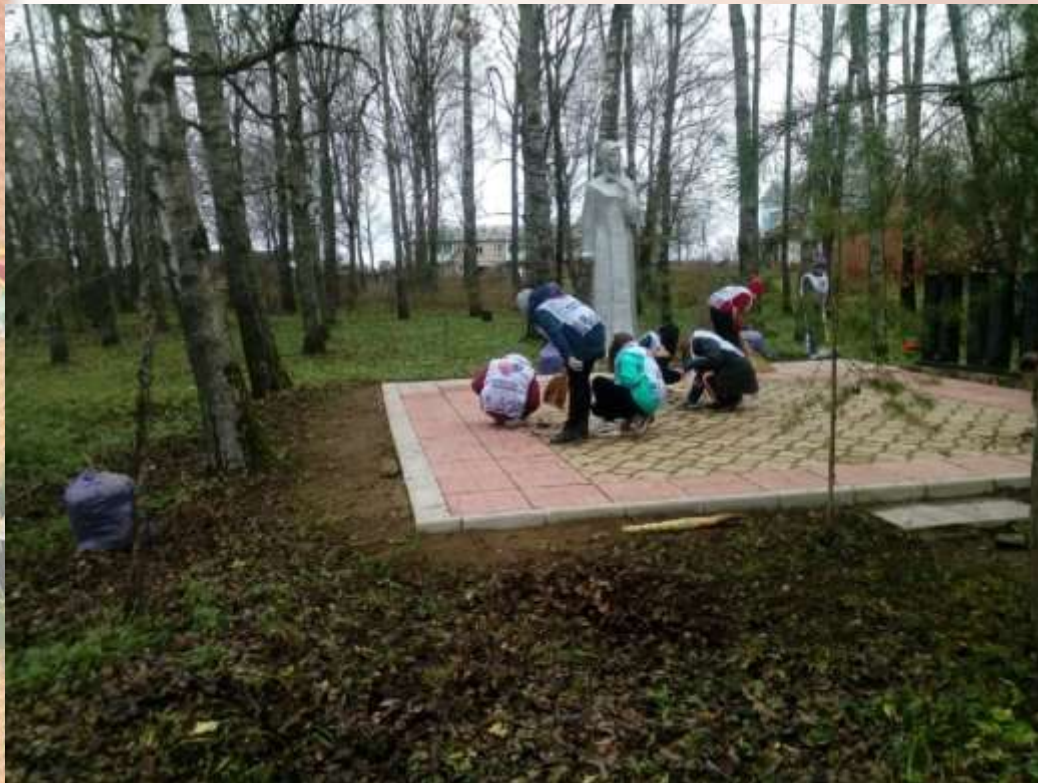
Осенняя уборка у памятника Скорбящей матери ( 7 класс)

И уборка могил ветеранов ВОВ и педагогического труда (5 класс) с.Пречистое