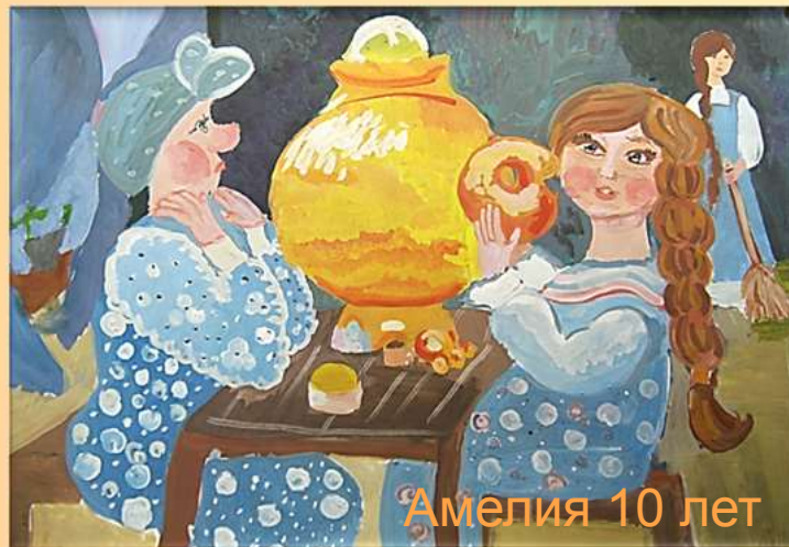
Амелия 10 лет