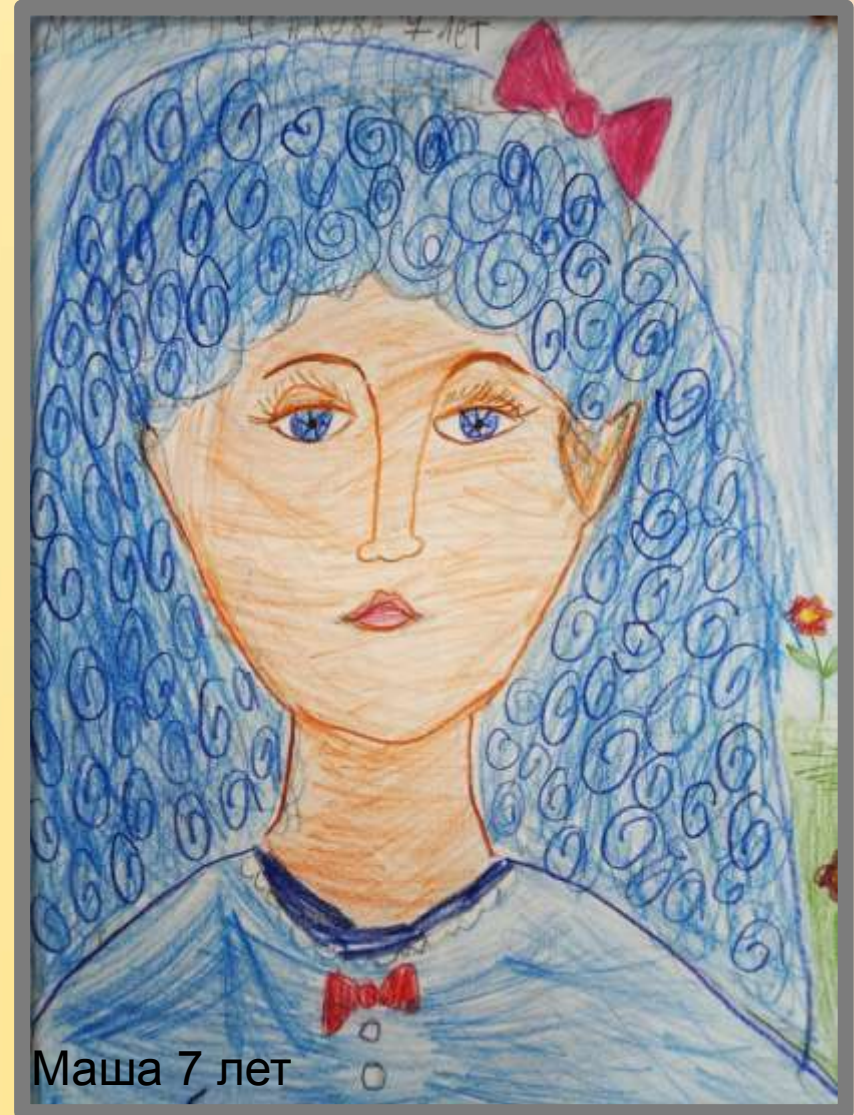
Маша 7 лет

При планировании занятий необходимо учитывать эмоционально-интеллектуальный уровень учащихся.