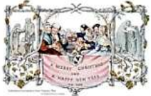
The first Christmas card was made in England in 1843.

The English Christmas season starts on the fourth Sunday before Christmas Day, usually around November 27 to December 3. This time is called Advent. People in England mark each Sunday with candles, a wreath or a calendar.