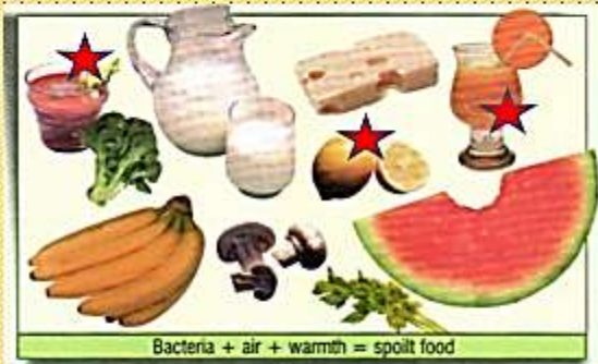
Bacteria + air + warmth = spoilt food