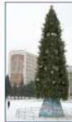
A yelka, or a decorated tree