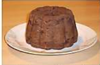
Christmas pudding is also known as plum pudding. It is a traditional English cake.

Some English families attend church on Christmas Day. Many will listen to the Queen on TV or radio when she gives her Christmas Day speech.