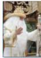
Dядя Мороз, or Grandfather Frost

On Christmas Eve, religious Russian families attend several church services. Between services, they will have a large family dinner called a Holy Supper. There are 12 different dishes at a Holy Supper, which represents the 12 Apostles of Jesus. The first of those dishes is usually lutit, a sweet pudding made of grain, honey, nuts and raisins.