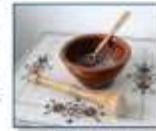
Lutit, a sweet Christmas Eve pudding