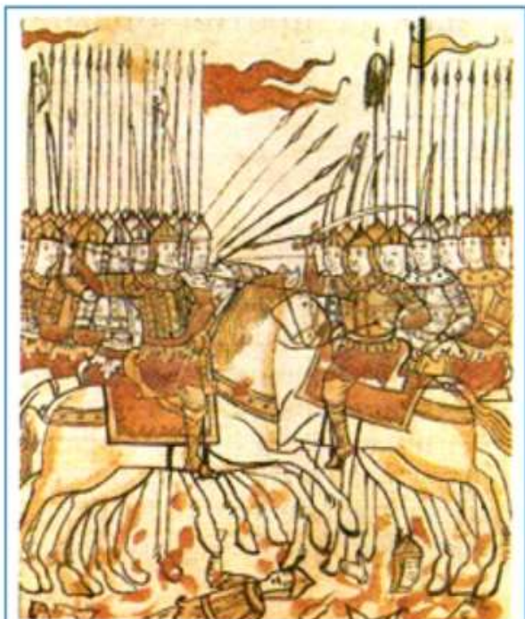
Битва на Куликовом поле. Миниатюра из русской рукописи

На основе знаний по теме сравните рисунки