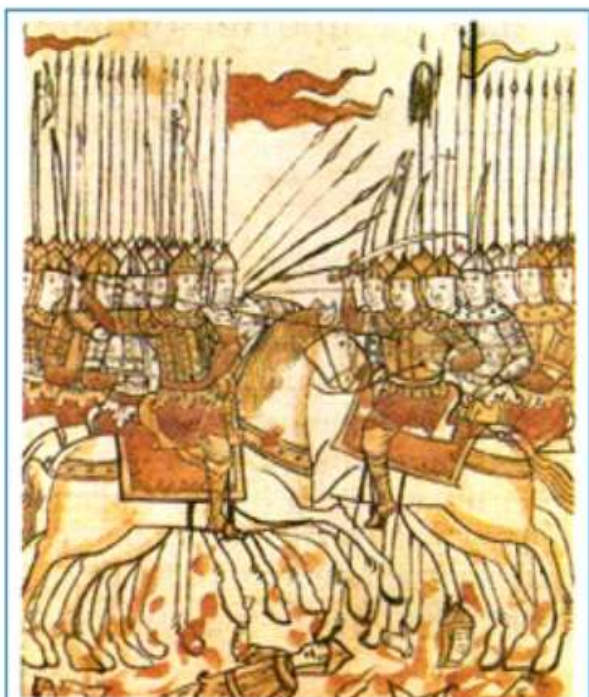
Битва на Куликовом поле. Миниатюра из русской рукописи

На основе знаний по теме сравните рисунки