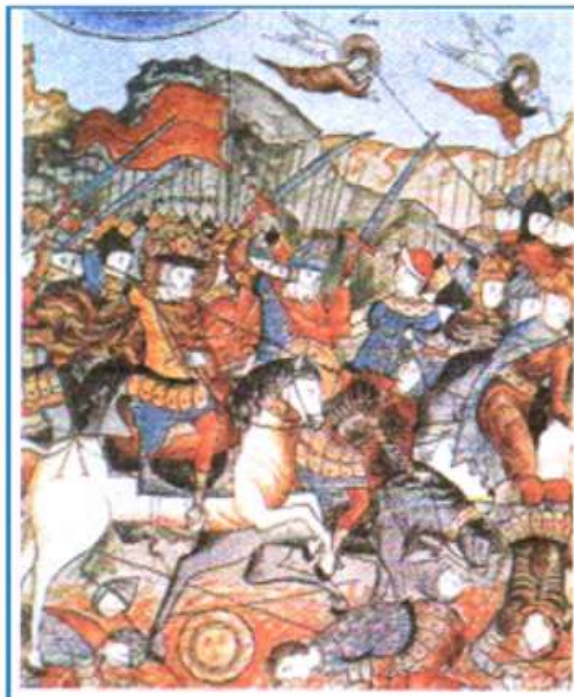
Победа на Куликовом поле. Миниатюра из русской рукописи

Ответы: На одном рисунке: битва, а на другом - победа в битве.