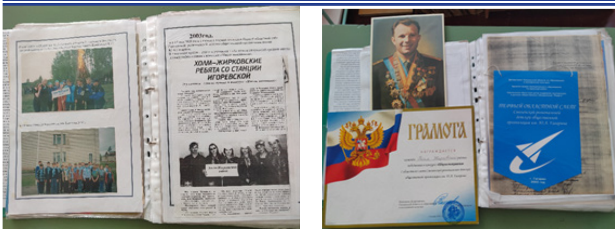
В школьном музее. Первые гагаринцы в школе и на первом слете в г. Гагарине

Представленный в музее материал интересен ребятам, потому что они находят на фотографиях знакомые лица, знакомые места, гордятся нашими школьными достижениями. А через эти страницы узнают подробности о жизни первого космонавта.