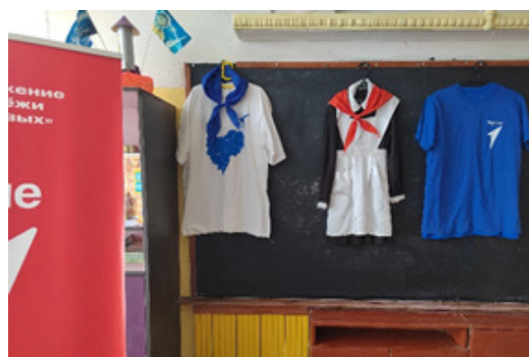
В школьном музее. Летопись ДОО «Юные гагаринцы». Гагаринская форма