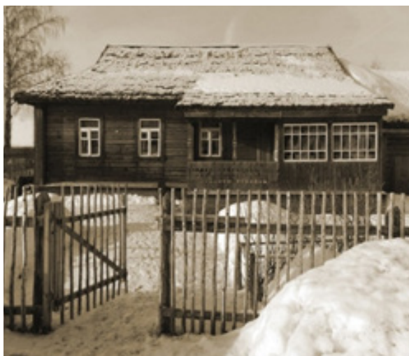
Дом семьи Гагариных в дер. Клушино

Юрий Алексеевич Гагарин родился 9 марта 1934-го года в семье, в которой всегда царил атмосфера доброжелательности и любви, несмотря на все трудности деревенской жизни. Маленький Юра жил в селе Клушино.