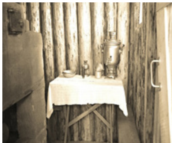
Внутренний вид землянки Гагариных.

В октябре в Клушино вошли немцы в серо-зелёных шинелях. Началось выживание в условиях оккупации. Гагариным пришлось покинуть свой дом и вырыть землянку размером четыре на четыре метра. Жилище отапливалось печкой-буржуйкой, а освещалось лучиной.