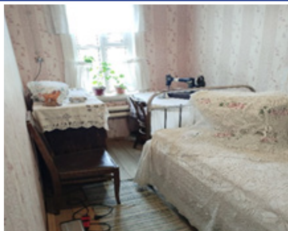
Внутри дома семьи Гагариных (, обучающиеся Болтутинской СШ на экскурсии в д. Клушино и г. Гагарине.)