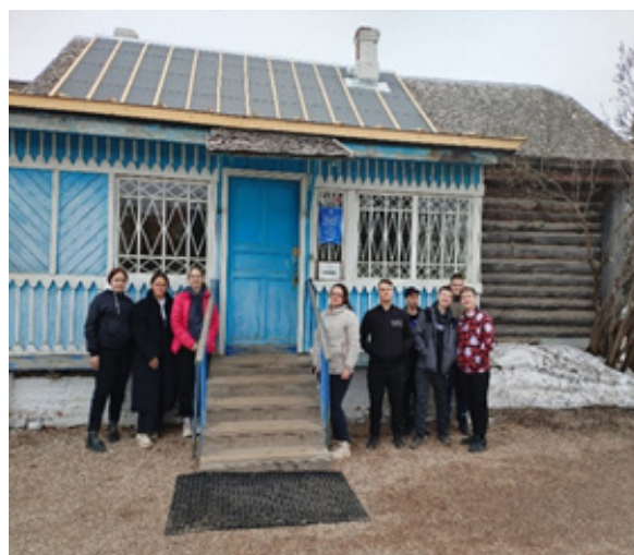
Дом семьи Гагариных в г. Гагарин (фото А.А. Корнеенкова, обучающиеся Болтутинской СШ на экскурсии в г. Гагарине)