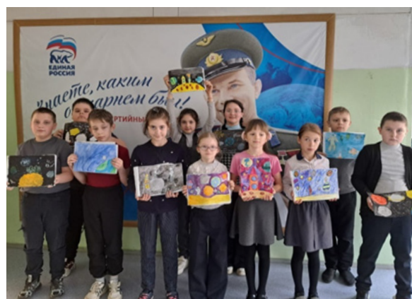
Учащиеся начальной школы принимают участие в конкурсе рисунков ко Дню Космонавтики.

фотоматериалы, и дети понимают, что они не ошиблись в своем представлении. В детском представлении о семье Ю.А. Гагарина всегда присутствуют слова: трудолюбивые, добрые, счастливые, дружные, честные.