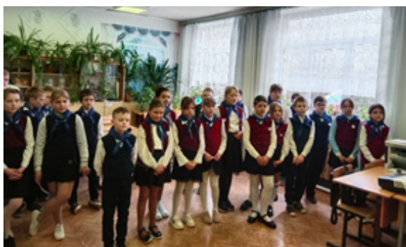
Библиотечный урок «Дорога в космос»

12 апреля проводится торжественный прием в организацию.