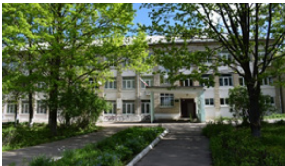
МКОУ «Новодугинская СШ»

В 1969 году состоялось торжественное открытие нового здания школы.