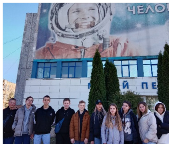
Музей первого полета

Организовываются экскурсии: В город Гагарин, д. Клушино.