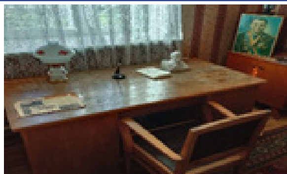
Дом родителей Гагарина

Проводятся книжные выставки, оформляются стенды, викторины: