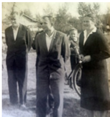
Депутат Ю.А. Гагарин в Новодугино

Гагаринский урок включен Министерством образования и науки Российской Федерации в Календарь образовательных событий и рекомендован к проведению в общеобразовательных организациях.