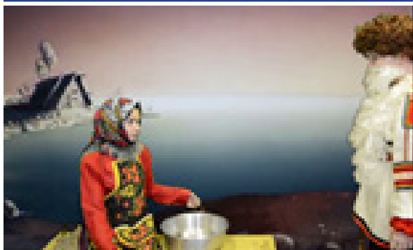
КТД «Сказки Пушкина»