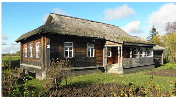
Дом-музей семьи Гагариных в деревне Клушино

Ученик (Юра) В Гжатске наша семья жила в деревянном доме, который туда перевезли по брёвнышку из села Клушино, где я родился. Дом этот собственными руками строил мой отец. Вся мебель в доме тоже была его рук делом: диван, буфет, кровать, стулья. У отца спорилась любая работа – и столяра, и каменщика, и пахаря, и слесаря. К этому он приучал и нас, трех сыновей и дочь. И мы гордились, когда впервые что-нибудь получалось самостоятельно: удалось ли запрячь лошадь, насадить топор на топорнице, поправить забор... Мама, Анна Тимофеевна, удивительно много читала. Она могла ответить почти на любой мой вопрос. Мне она казалась неиссякаемым источником мудрости.