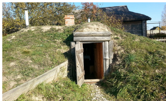
Землянка в деревне Клушино, в которой во время оккупации жила семья Гагариных

В село 12 октября пришли фашисты, выгнали людей из домов. Пришлось копать землянки, кое-как ютиться в тесноте и сырости, терпеть унижения.