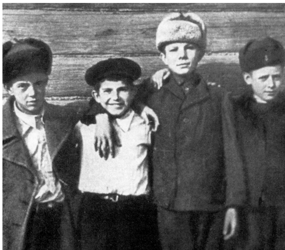
Юра Гагарин с деревенскими друзьями в Клушино.